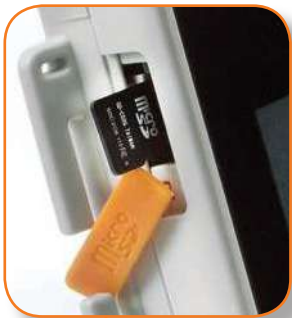
Tarjeta de memoria Micro SD extraíble.